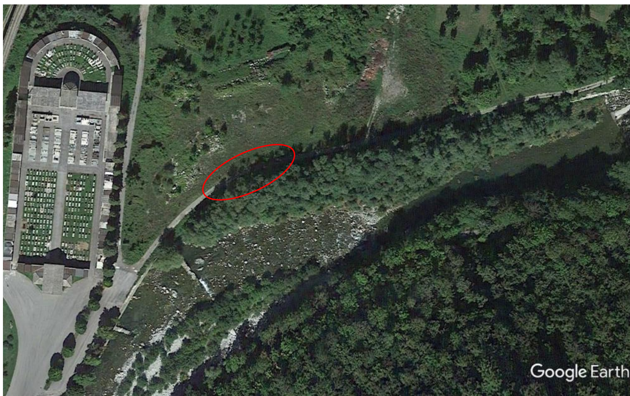
Foto 1: inquadramento aereo dell'area di intervento antecedente all'evento alluvionale.