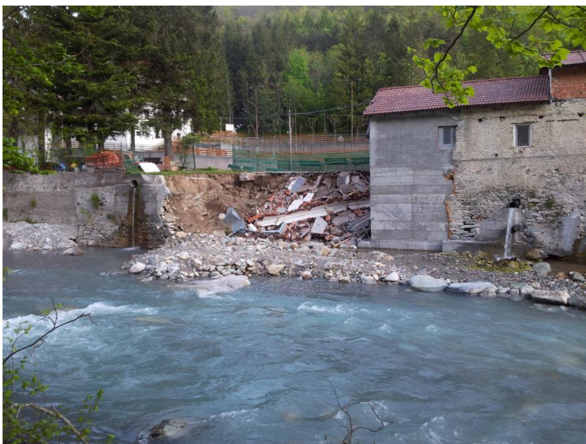
Foto 3: dettaglio della nicchia di erosione che ha causato la distruzione di una porzione del fabbricato.