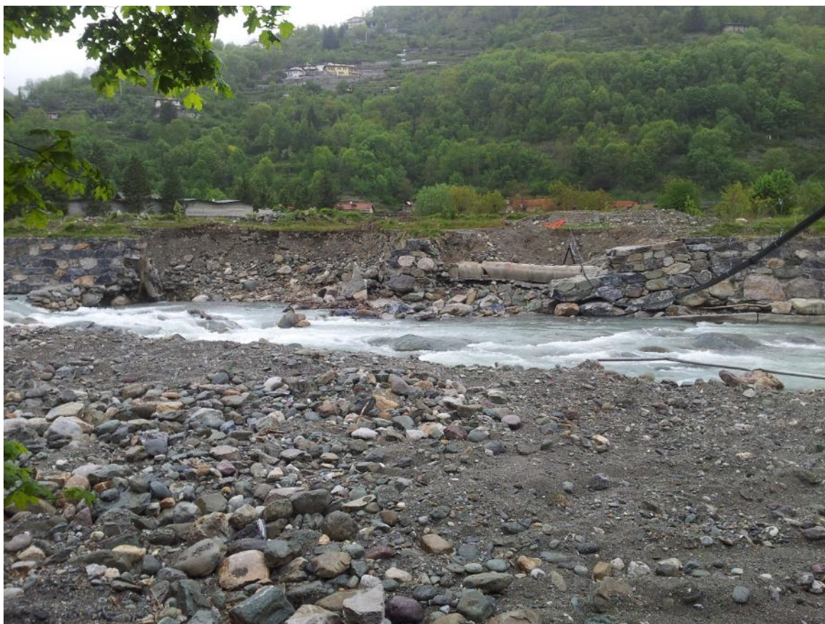
Foto 5: vista dell'area di intervento dalla sponda opposta del fiume.