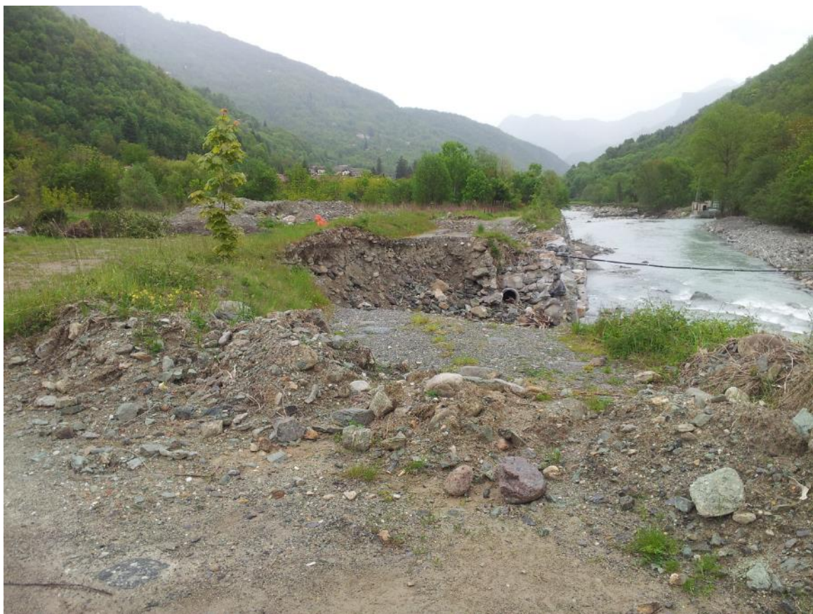
Foto 3: particolare delle nicchie di erosione in sponda sinistra – vista verso valle.