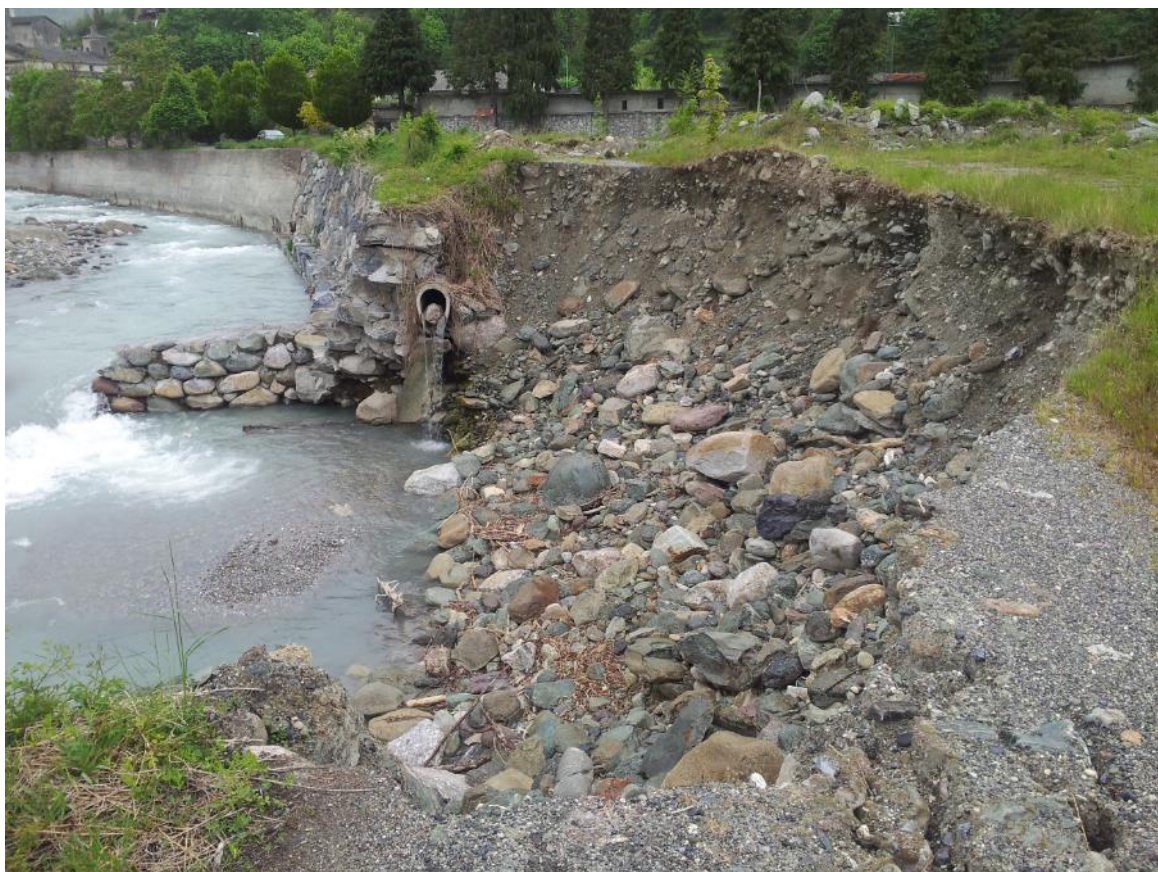
Foto 4: particolare delle nicchie di erosione in sponda sinistra – vista verso monte.