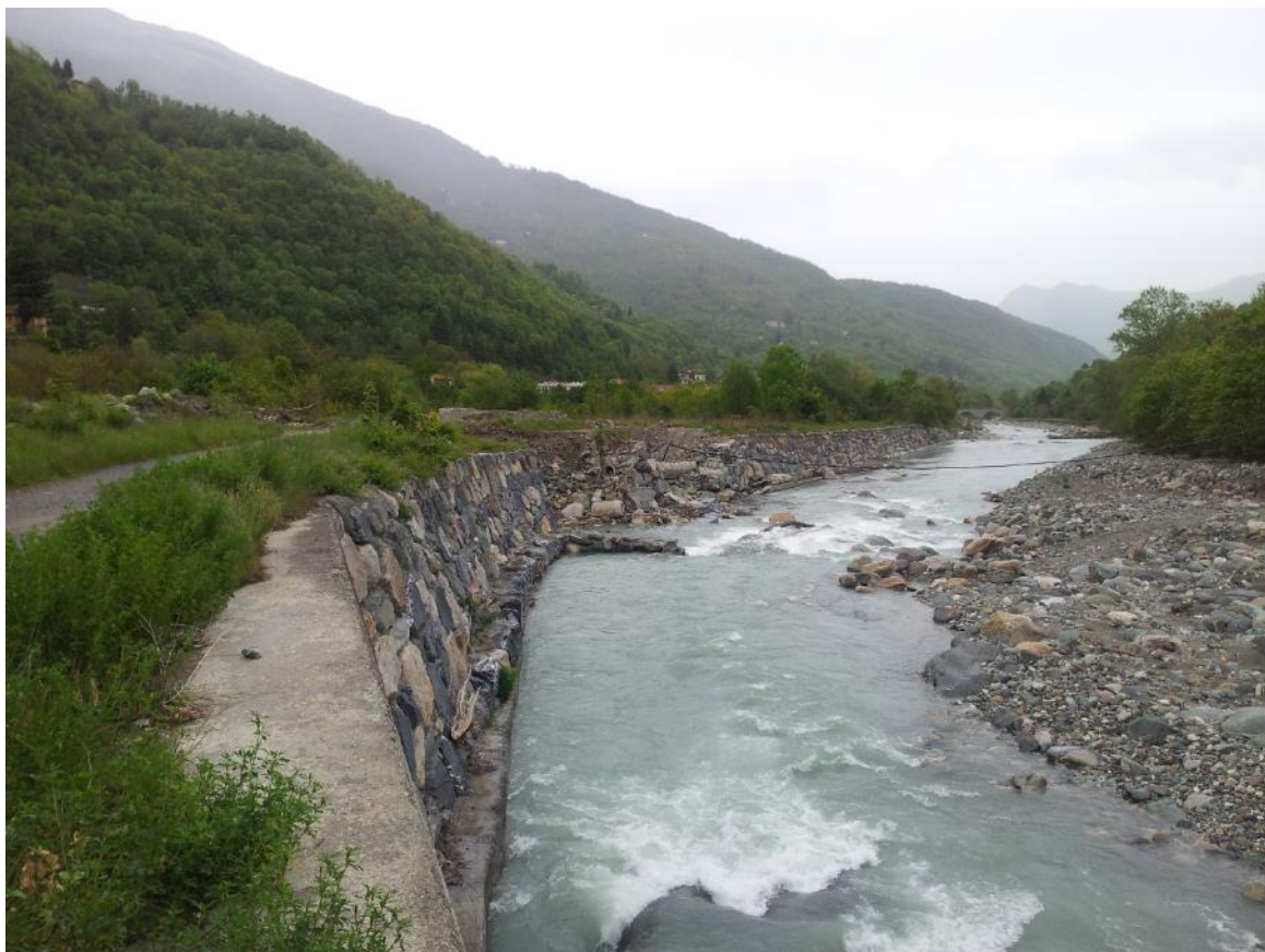
Foto 2: vista da monte verso valle – parte della difesa spondale realizzata mediante scogliera in massi è stata asportata.